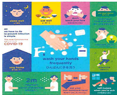
感染予防のために、できること。